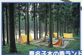
真名子木の香ランド